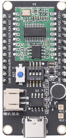
表 2.2 PIN 脚功能定义